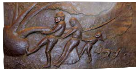
おおきななぐ 1レリーフ