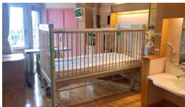
病室(小児病棟個室)

◎緊急入院や患者さんの状態により、部屋を替わっていただく場合もありますのでご了承ください。