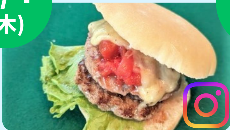
鉄パン屋 (ハンバーガー)