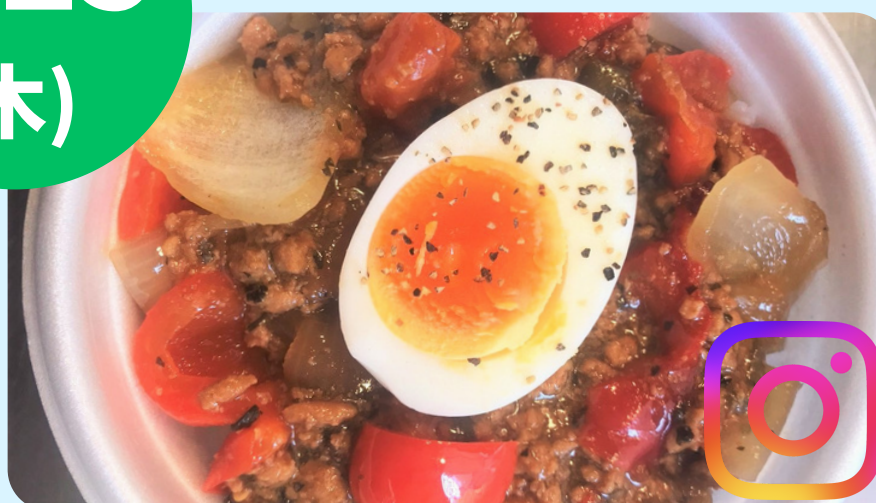
醍醐味 (ガパオライス)