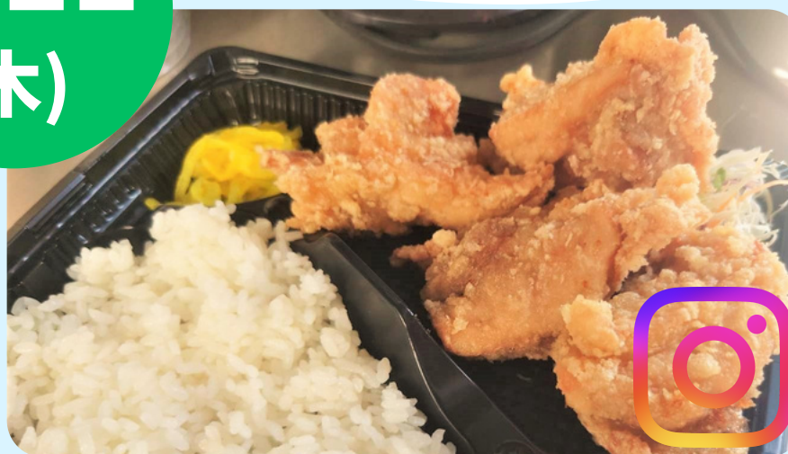
名取フードサービス (からあげ弁当)