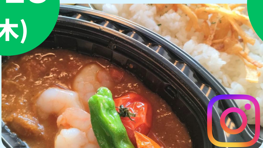
J's グリル (カレー各種)