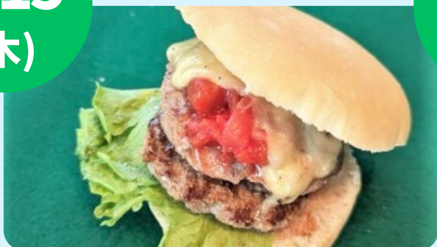
鉄パン屋 (ハンバーガー・日替わり弁当等)