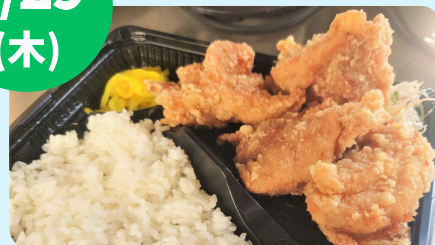
名取フードサービス (日替わり弁当・ローストビーフ丼)

※ ごみは各車で受取回収します。または、所定のごみ箱へ廃棄してください。 ※ 病院内での飲食は、入院されている病棟または拓桃館1階のひだまりラウンジにてお願いします。