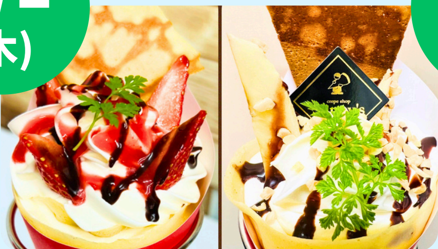
crepe shop Sunny's 仙台店 (クレープ各種)