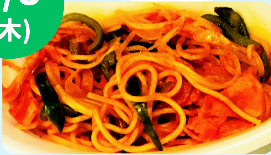
のぼs kitchen (ナポリタン・チキンサラダうどん等)