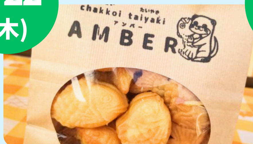
AMBER (ミニたい焼き・玉コン等)